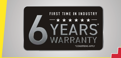
વોરંટીમાં PLUS - ઉદ્યોગ ક્ષેત્રે પહેલી જ વાર 6 વર્ષની વોરંટી*