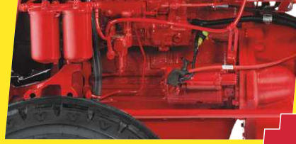
पावर में PLUS - ज़्यादा पावर