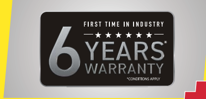
वॉरंटी में PLUS- इंडस्ट्री में पहली बार 6 साल की वॉरंटी*