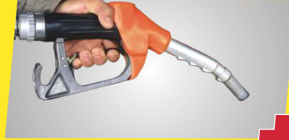
माइलेज में PLUS - श्रेणी में ईंधन की सबसे ज़्यादा बचत