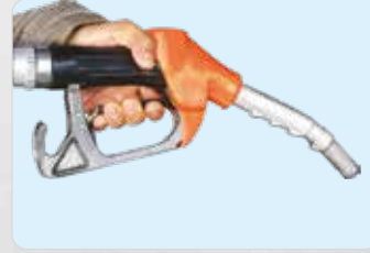
श्रेणी में सबसे ज़्यादा माइलेज