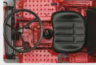
टफ़ काम में भी ज़्यादा आराम