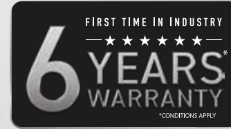
इंडस्ट्री में पहली बार 6 साल की वारंटी

*नियम व शर्तें: क्रिएटिव में दिखाई गई एक्सेसरीज़ और तस्वीरों में समय-समय अनुसार फ़र्क़ या बदलाव हो सकता है.