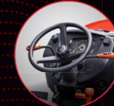
ਟਿਲਟ ਐਂਡ ਟੈਲੀਸਕੋਪਿੰਗ ਸਟੀਅਰਿੰਗ