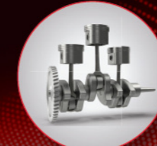
ਸ਼ਕਤੀਸ਼ਾਲੀ 3DI ਇੰਜਨ

ਇਸ ਉਤਪਾਦਕਤਾ ਤਕਨੀਕੀ ਪੈਕ ਵਿੱਚ ਅਜਿਹੀਆਂ ਅਦਭੁੱਤ ਵਿਸ਼ੇਸ਼ਤਾਵਾਂ ਹਨ ਜੋ ਕਿ ਤੁਹਾਡੇ ਖੇਤ ਦੀ ਉਤਪਾਦਕਤਾ ਵਧਾਉਣਗੀਆਂ ਅਤੇ ਤੁਹਾਡੀ ਆਮਦਨ ਵੀ ਵਧਾਉਣਗੀਆਂ।