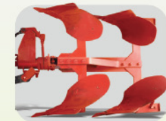
रिवर्सिबल MB प्लाऊ