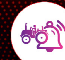
लाइव लोकेशन तथा जियोफेंस

यह इंटेलिजेन्ट टेक पैक आपको अपने ट्रैक्टर की सेहत और काम करने की क्षमता पर रियल टाइम निगरानी रखने में मदद करता है।