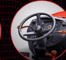
टिल्ट और टेलीस्कोपिक स्टीयरिंग