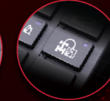
ऑटो इम्प्लीमेंट लिफ्ट