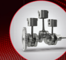
दमदार 3DI इंजन

इस प्रोडक्टिविटी टेक पैक में ऐसी शानदार खूबियां हैं जो आपकी खेती में उत्पादकता को बढ़ाएगा तथा आपकी आमदनी भी बढ़ाएगा।