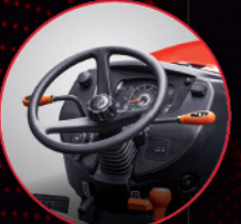
टिल्ट और टेलीस्कोपिक स्टीयरिंग