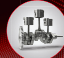
दमदार 3DI इंजन

या प्रॉडक्टिविटी टेक पॅकमध्ये अशी शानदार वैशिष्ट्ये आहेत की तुमच्या शेतीची उत्पादकता वाढेल आणि तुमचं उत्पन्नही वाढेल.