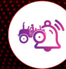
लाइव लोकेशन आणि जियोफेस

हा इंटेलिजेंट टेक पॅक तुम्हाला तुमच्या ट्रॅक्टरच्या आरोग्यावर आणि काम करण्याच्या क्षमतेवर रियल टाइम देखभाल करायला मदत करतो.