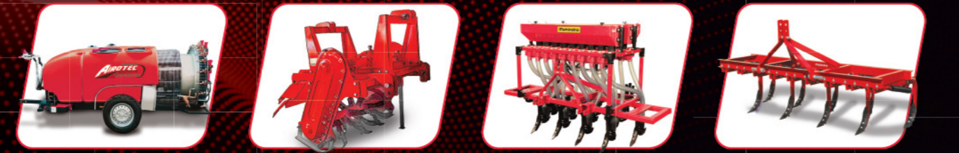
ஸ்ப்ரேயர் ஃபார்வாடு-ரிவர்ஸ் ரோட்டாவேட்டர் சீட் டிரில் கல்டிவேட்டர்