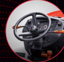
டில் மற்றும் டெலிஸ்கோபிக் ஸ்டீயரிங்