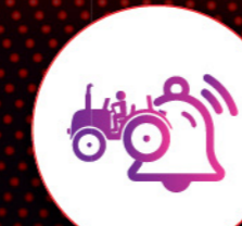
லைவ் லொகேஷன் மற்றும் ஜியோஃபென்ஸ்

இந்த அறிவார்ந்த டெக் பேக் உங்கள் டிராக்டரின் ஹெல்த் மற்றும் பெர்ஃபார்மென்ஸை உடனுக்குடன் கண்காணிக்க உதவுகிறது.