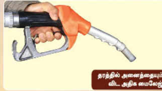
தரத்தில் அனைத்துமேயும் விட அதிக மைலேஜ்