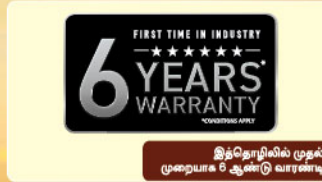
இந்தொழியில் முதல் முறையாக 6 ஆண்டு வாரண்டிங்